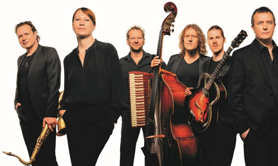
Die Schauspielerin Birgit Minichmayr (letzte Kinofilme „Andrea lässt sich scheiden“ und „Mit einem Tiger schlafen“) präsentiert gemeinsam mit der Weltmusik-Formation Quadro Nuevo am 18. Januar 2025 einen Abend mit neu vertonten Sonetten von William Shakespeare.